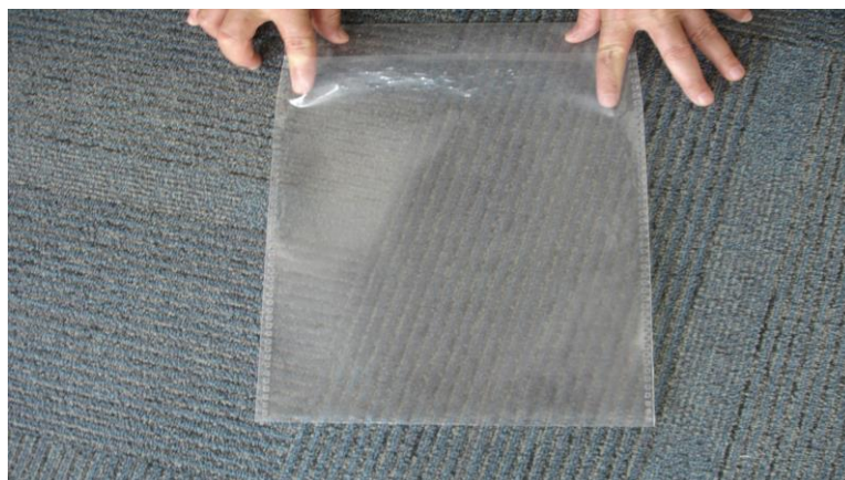
Lote Único – Foto 02