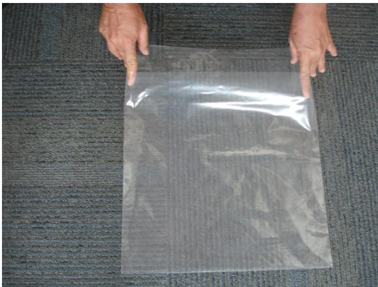
Lote 01 – Foto 02