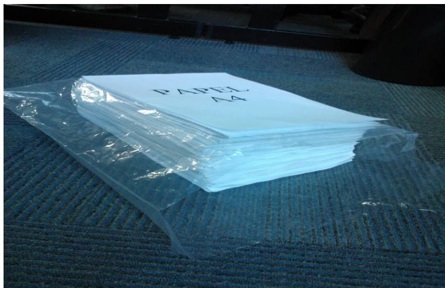
Lote 01 – Foto 05

Endereço: Rua Sergipe, 64 - CEP: 30.130-170 - Belo Horizonte - MG TEL.: (31) 3235-2367 - FAX: (31) 3235-2357 - E-mail: licita@jucemg.mg.gov.br