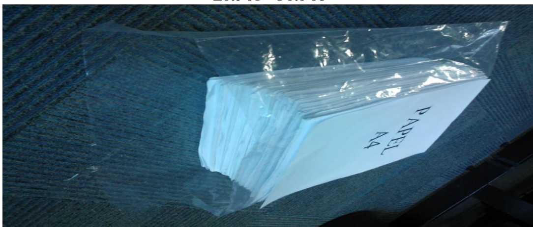
Lote 01 – Foto 07