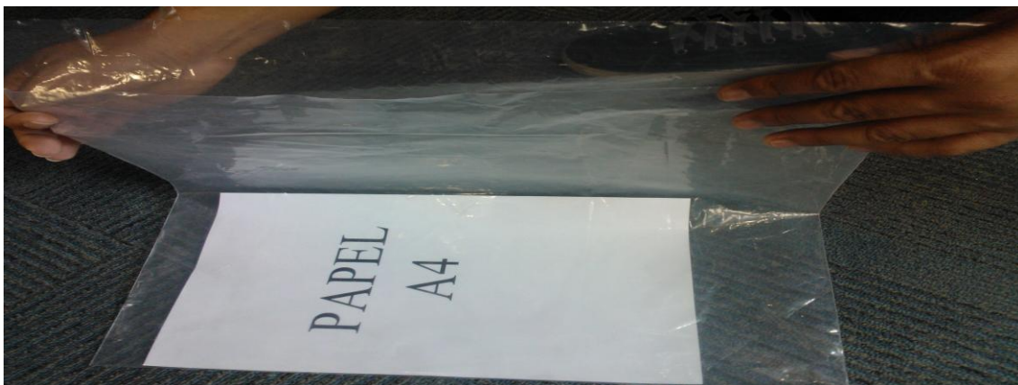
Lote 01 – Foto 06